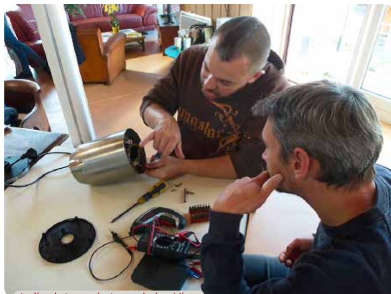
Atelier de Lavaveix, Lavaveix-les-Mines