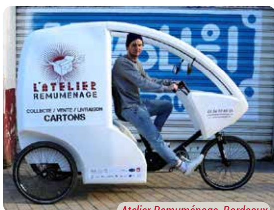
Atelier Remuménage, Bordeaux