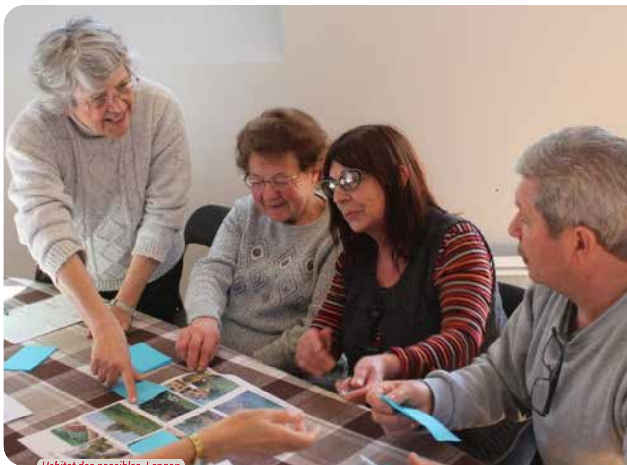
Habitat des possibles, Langon